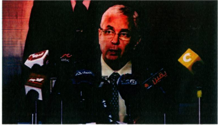
وزير التعليم العالي

دعا الدكتور السيد عبد الخالق، وزير التعليم العالي، مساء اليوم الأحد، الأكاديمية العربية للعلوم والتكنولوجيا والنقل البحري إلى إنشاء آلية للتواصل مع خريجي الدول العربية والتواصل الدائم معهم.