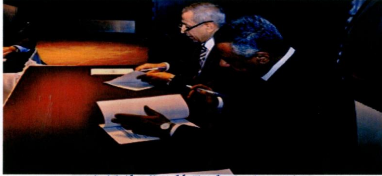
برتوكول تعاون ووضع برنامج قومي لتنمية قدرات الشباب قبل التعليم الجامعي

وقعت الاكاديمية العربية يوم الجمعة ١٤ فبراير ٢٠١٤ بروتوكول تعاون علمي مع وزارة التربية والتعليم بالحكومة المصرية التي جاءت في ظل حرص الطرفين على التعاون المثمر بينهما والذي أقيم بفندق فلسطين بالأسكندرية.