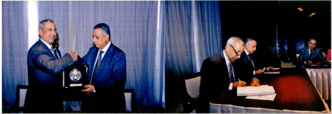
بروتوكول تعاون لتنمية قدرات الطلاب